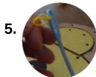
Eine große Nadel mit einem Faden vorbereiten.