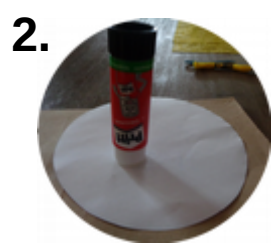
Alles auf eine Pappe kleben.