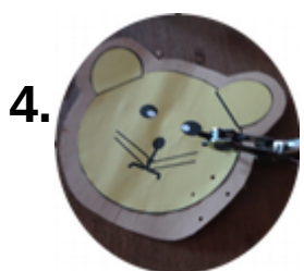
Die Löcher mit der Lochzange ausstanzen.