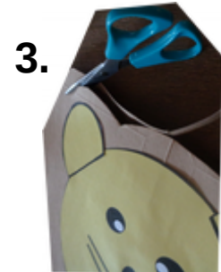
Die Löwenkopfpappe mit Abstand ausschneiden.